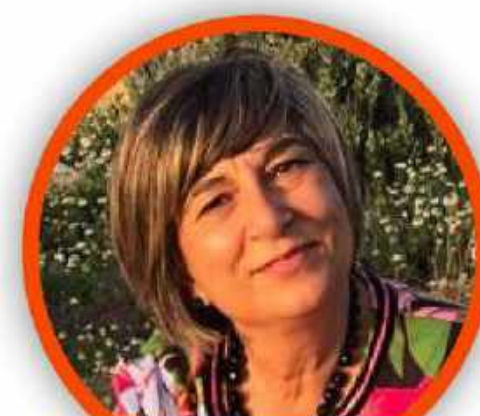
GIOVANNA MARIA BURRELLI SCUOLA PRIMARIA