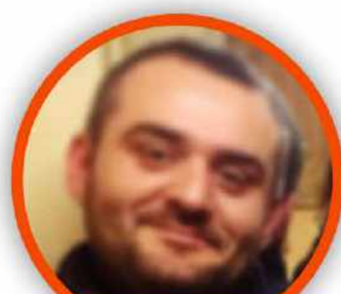
ROBERTO ZOLLO SCUOLA PRIMARIA